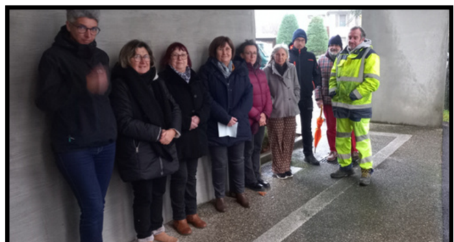
Elus et agents réunis sur le parvis de la mairie avant d'observer une minute de silence en hommage aux victimes et aux habitants de Mayotte.

10 jours après le passage dévastateur du cyclone "Chido" sur l'île de Mayotte, une journée de deuil national, décrétée par le Président de la République à eu lieu le lundi 23 décembre dernier. Cette décision reste relativement rare en France, ce n'est que la 10ème fois qu'une telle journée est décrétée sous la 5ème république.