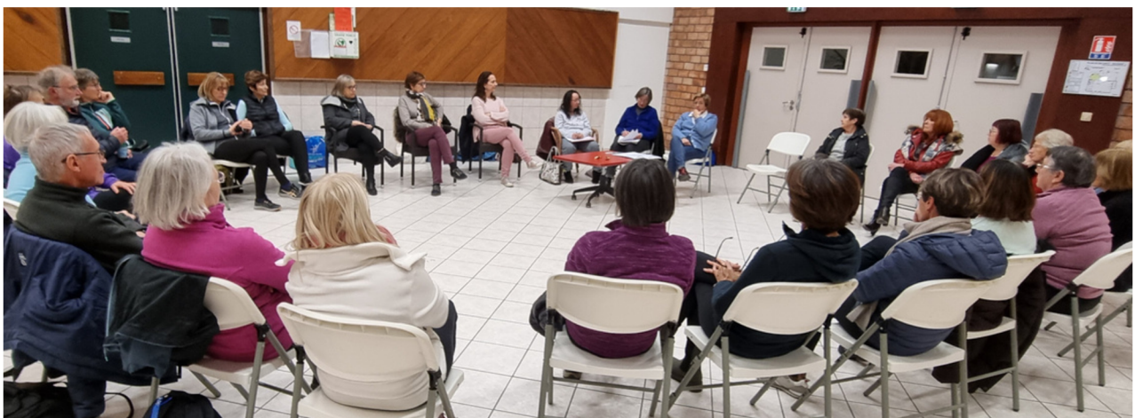
Le bilan de 2024 a été présenté. Les nouvelles animatrices sont bien appréciées. Le remplacement progressif de Chantal Château est une tâche difficile ! Le bureau a été renouvelé, sans changement. La galette et le cidre pour terminer ont amené une note festive.