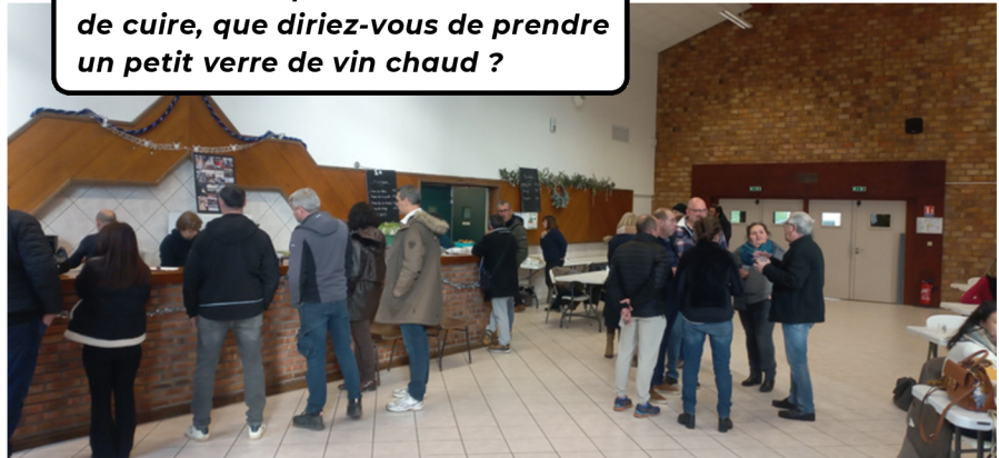
En attendant que le boudin finisse de cuire, que diriez-vous de prendre un petit verre de vin chaud ?

12 JANVIER : MATINÉE BOUDIN À LA CHAUDIÈRE ORGANISÉE PAR LE COMITÉ D'ANIMATION